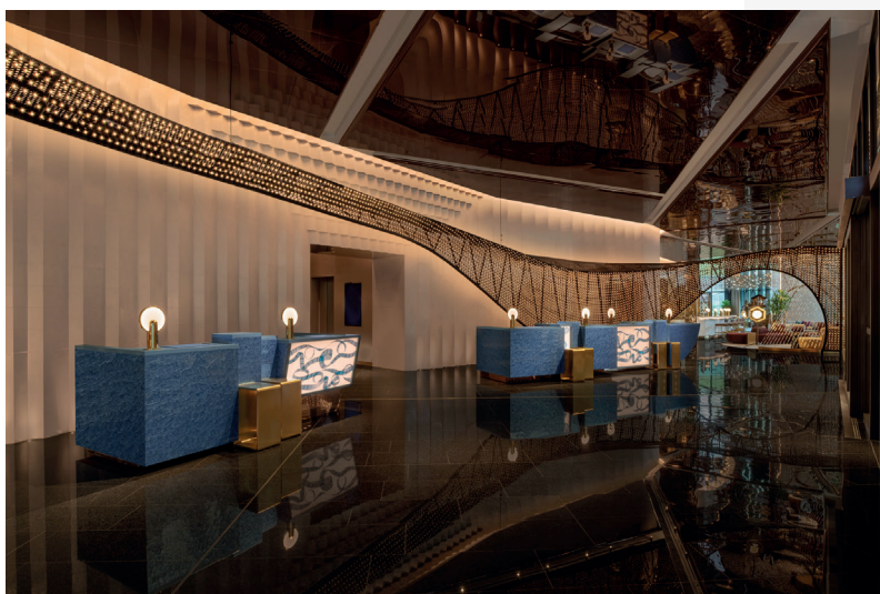
© W Macau – Studio City