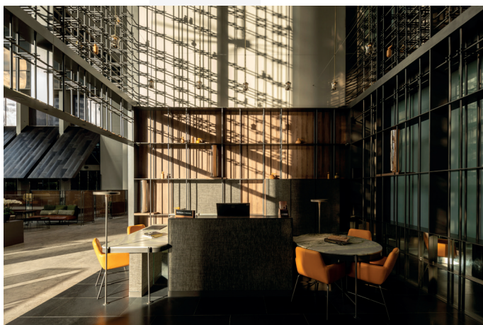
© Pan Pacific Hotels and Resorts

Dans le quartier d'Orchard Road, d'une ville surnommée Garden City, l'agence d'architecture WOHA fusionne architecture et nature avec une impressionnante combinaison d'espaces intérieurs et extérieurs, offrant notamment au second niveau une oasis tropicale, avec une plage de sable sinueuse et des palmeraies entourant un lagon émeraude.