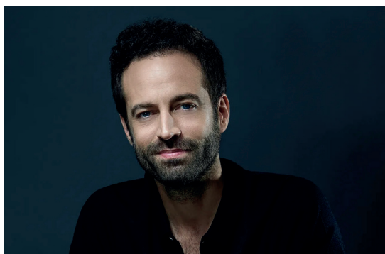
BENJAMIN MILLEPIED Danseur, Chorégraphe Président du Jury mondial (France)