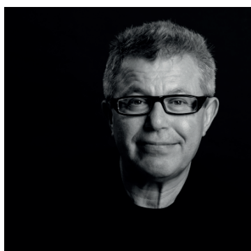
DANIEL LIBESKIND Architecte (États-Unis)