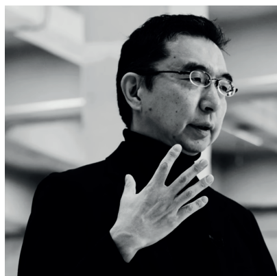
SOU FUJIMOTO Architecte (Japon)