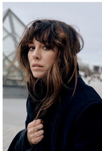
BLANCA SUÁREZ Actrice (Espagne)