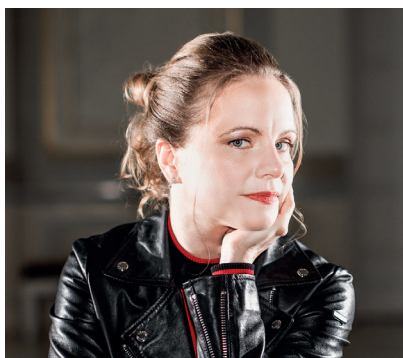
JULIA FISCHER Violoniste (Allemagne)