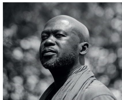
DAVID ADJAYE Architecte (Ghana - Royaume-Uni)