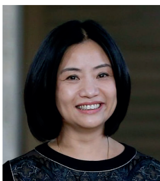
GUO PEI Styliste (Chine)